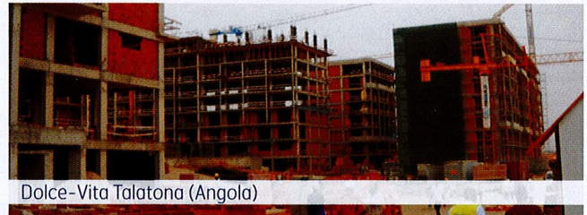
Dolce-Vita Talatona (Angola)

A Qualidade e a Exigência fazem parte da nossa cultura, numa busca constante da Melhoria e da Satisfação dos nossos clientes.