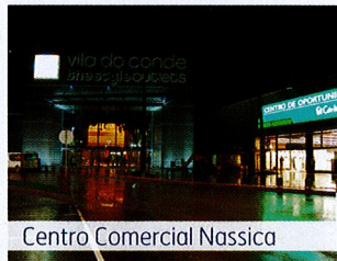
Centro Comercial Nassica