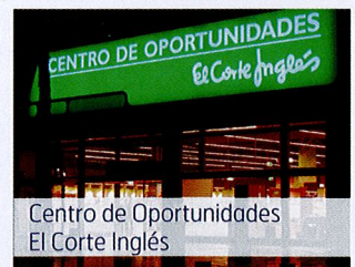
Centro de Oportunidades El Corte Inglés