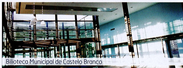
Biblioteca Municipal de Castelo Branco