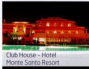
Club House - Hotel Monte Santo Resort