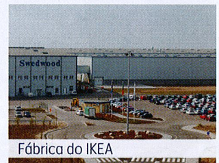
Fábrica do IKEA