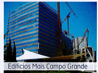
Edifícios Mais Campo Grande