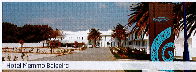
Hotel Memmo Baleira