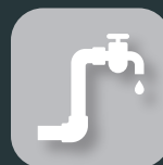
Águas e saneamento